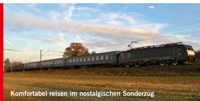
Komfortabel reisen im nostalgischen Sonderzug

Einmalige Schienenkreuzfahrt durch Italien, Slowenien, Kroatien, Serbien, Bulgarien bis nach Istanbul. Sie fahren im nostalgischen Intercity-Zug durch spannende Landschaften, wohnen in guten Hotels und entdecken interessante Städte und Kulturen. www.schweizerfamilie.ch/istanbul